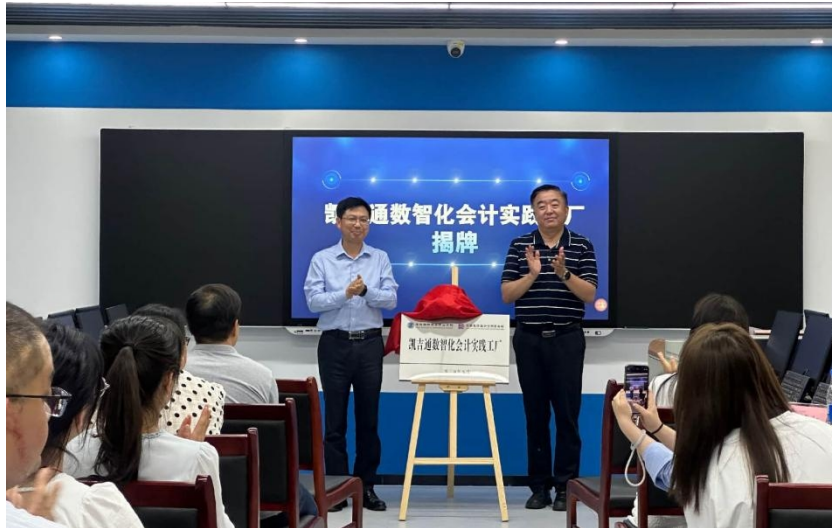
图1 凯吉通数智化会计实践工厂揭牌