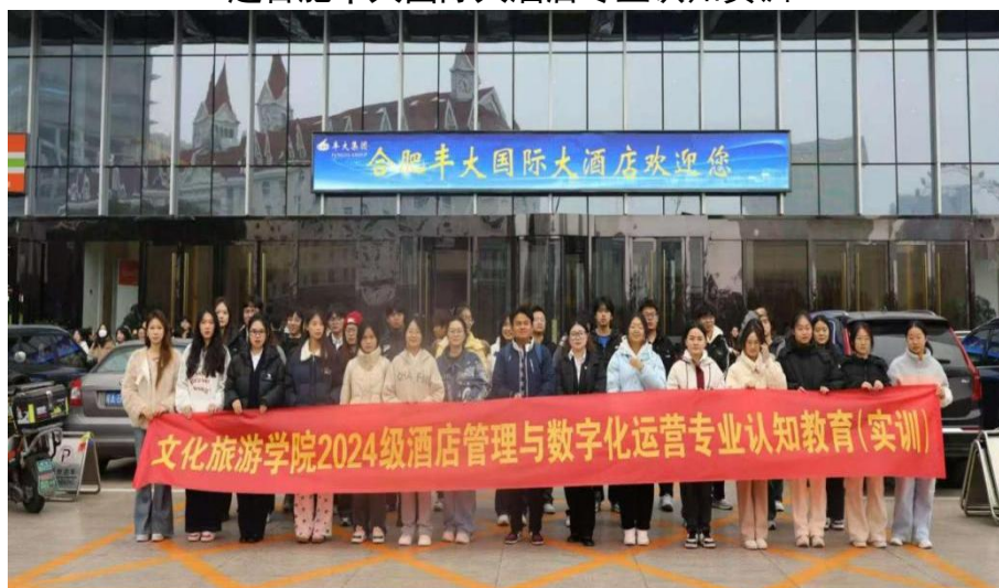
图3 酒店管理与数字化运营 243 班赴合肥丰大国际大酒店专业认知实训