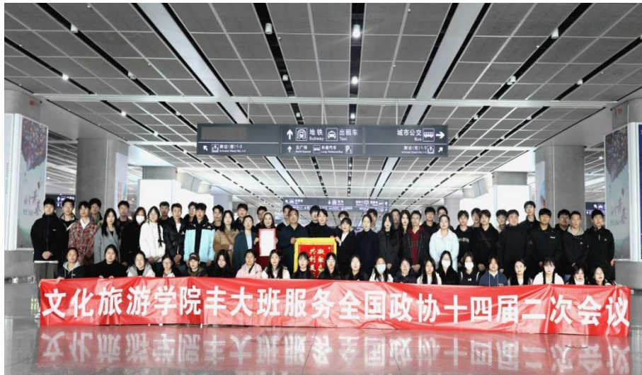
图5 2024年“丰大职业经理班”服务全国政协十四届二次会议