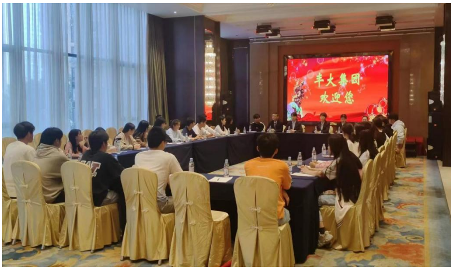
图1 企业讲师为学生授课

企业讲师为学生授课是校企合作中的一项重要举措，2024年，委派酒店中、高层管理人员4名为学生开展专题讲座，介绍酒店行业的现状、发展趋势、挑战与机遇，并将自己在企业中的实际工作经验、行业洞察以及最新技术动态融入教学中，为学生提供最前沿、最实用的知识和技能。