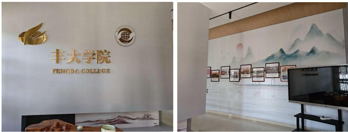
图4 丰大学院内部照片

2024年，与学校联合成立丰大学院，是双方进一步深化产教融合和校企合作，推进人才培养模式创新和校企合作共赢的深耕之笔，集团将与学校齐心协力携手搭建师资共育平台、课程资源平台、实训资源平台、产教研合作平台，共同建设丰大学院，并不断挖掘丰大学院合作工作亮点、创新点，为现代酒店服务行业培养高端服务与管理人才，为区域经济社会发展作出应有的贡献。